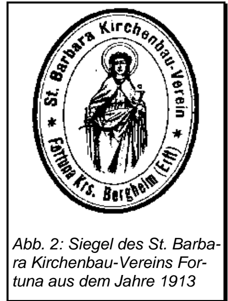
Abb. 2: Siegel des St. Barbara Kirchenbau-Vereins Fortuna aus dem Jahre 1913

§ 10. Der Kirchenvorstand von Oberaussem verwaltet die eingegangenen Gelder des Vereins und führt dieselben unter einer besonderen Rubrik in der Kirchenrechnung auf, wobei die Zinsen jedes Jahr zum Kapital zugeschrieben werden. Sämtliche eingezahlten Gelder dürfen nur zu einer römisch - katholischen Kirche im Bezirke Fortuna verwandt werden.