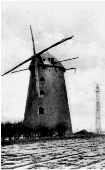
Oberaußemer Windmühle in den 1930ige Jahren. Rechts im Hintergrund das Leuchttfeuer der Flugstrecke Köln – Brüssel.