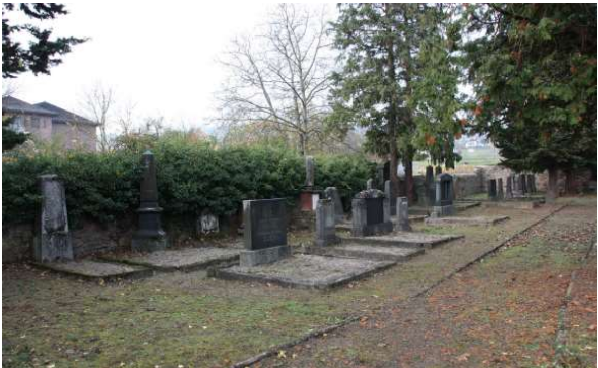
Westliche Seite von Tora aus gesehen