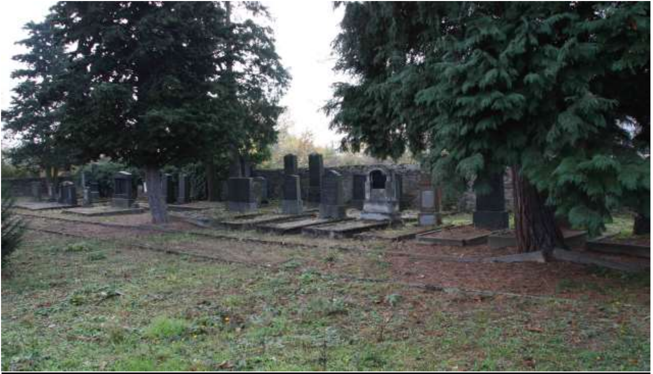
Westliche Seite von Rückwand aus gesehen